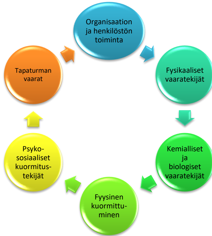
Kuva 5. Pienryhmäkoti Vennin vaarojen ja riskien arvioinnin aihealueet (mukailien Laatuportin raportti, 2025).

Vaarojen ja riskien arvioinneissa on käytössä kuusi eri aihealuetta, joista jokaisessa on erillisiä kohtia, jotka arvioidaan aiheuttavan vaaraa tai haittaa, ei aiheuta vaaraa tai haittaa tai siitä ei ole tietoa. Tämän lisäksi raporttiin merkintään kommentteja tai tarkennuksia kyseisiin kohtiin. Raporttiin kirjataan myös hallintajärjestelmät ja toimintatavat, mikäli aihealueessa jokin kohta aiheuttaa vaaraa tai haittaa kuvaten vaaratilanne, arvioiden riskitaso (kuva 6.), toimenpiteet, vastuuhenkilö ja aikataulu. Kuvassa 6 on esitelty riskitason arviointimatriisi.