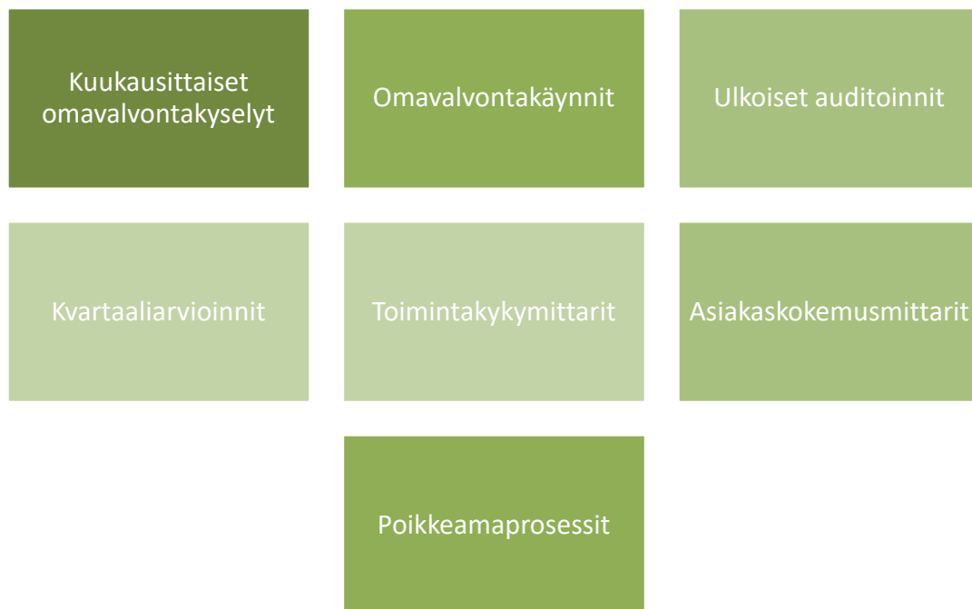
Kuva 3. Laadun mittaamisen työkalut.

Puitesopimuksessa mainittua, mikäli palvelu ei ole sopimuksen mukaista, on palveluntuottaja ryhdyttävä välittömästi toimenpiteisiin palvelun korjaamiseksi sopimuksen mukaiseksi. Toimenpiteet ja toteutusaikataulu on hyväksyttävä tilaajalla. Palveluntuottaja sitoutuu pyydettyä antamaan selvityksen toiminnastaan tilaajalle tilaajan ilmoittamaan määräaikaan mennessä.